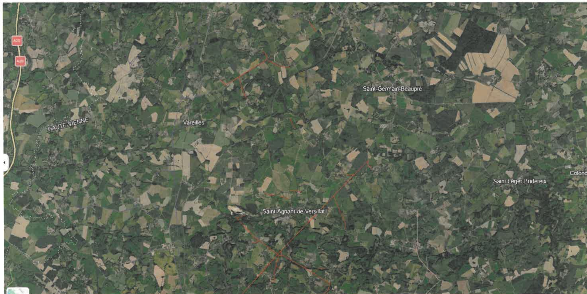
Plan Prevention Travaux Drone Lignes Electriques Mairies