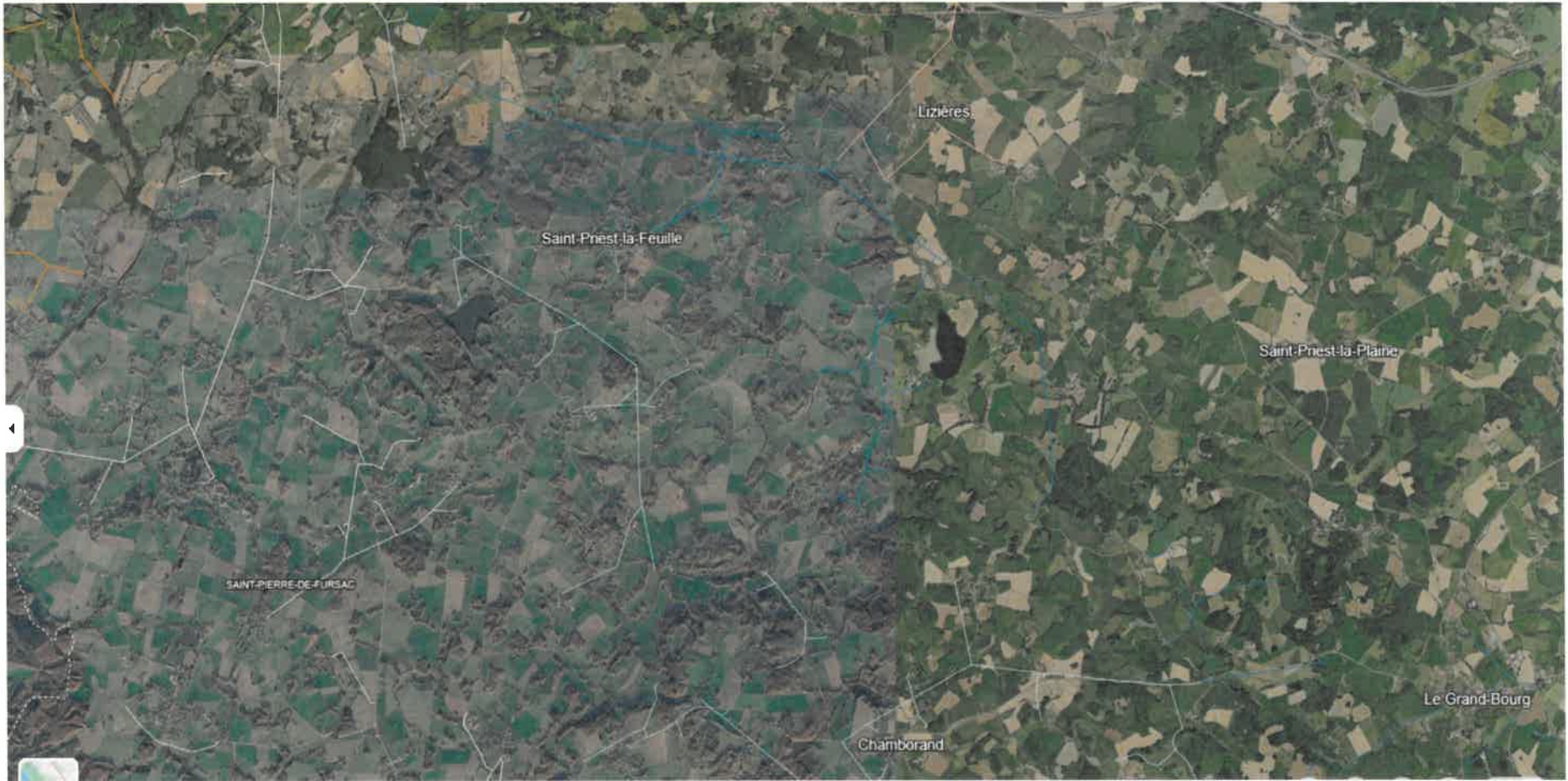
Plan Prevention Travaux Drone Lignes Electriques Mairies